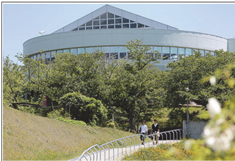
写真は「厚生館(学食)」です

<IMG SRC="kousei.jpg" ALIGN="middle"> 写真は「厚生館(学食)」です